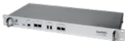
ScanDAKS ab Version V1.0x